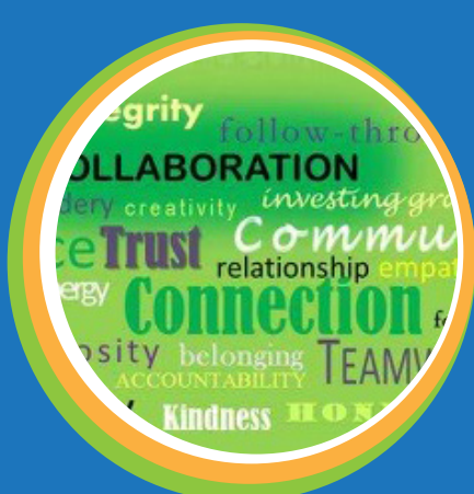
Informe “desde la primera línea: historias de nuestros héroes comunitarios en servicio a la salud mental”