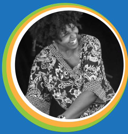
Eki Shola El Poder de Música para Sanar el Corazón